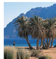
Abenteurer Tauchurlaub, inmitten der ägyptischen Wüste.