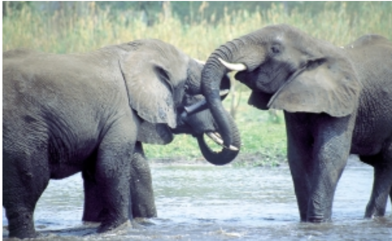
Liwonde National Park: Rüsselbegrüßung am Elephant Bath

ein bis zwei Metern Entfernung direkt neben den Zelten hört oder wenn am nächsten Morgen ein Ast oder ein halber Baum vor dem Eingang vom nächtlichen Mahl zeugen.