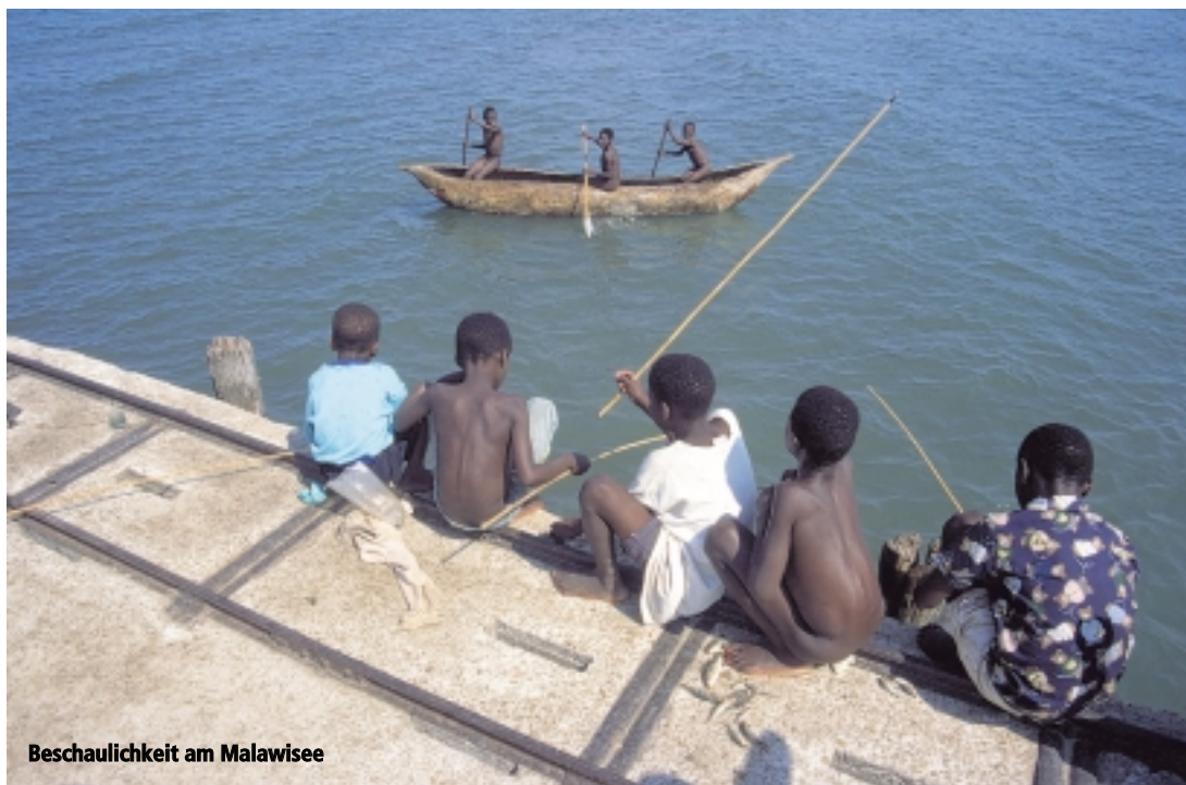
Beschaulichkeit am Malawisee